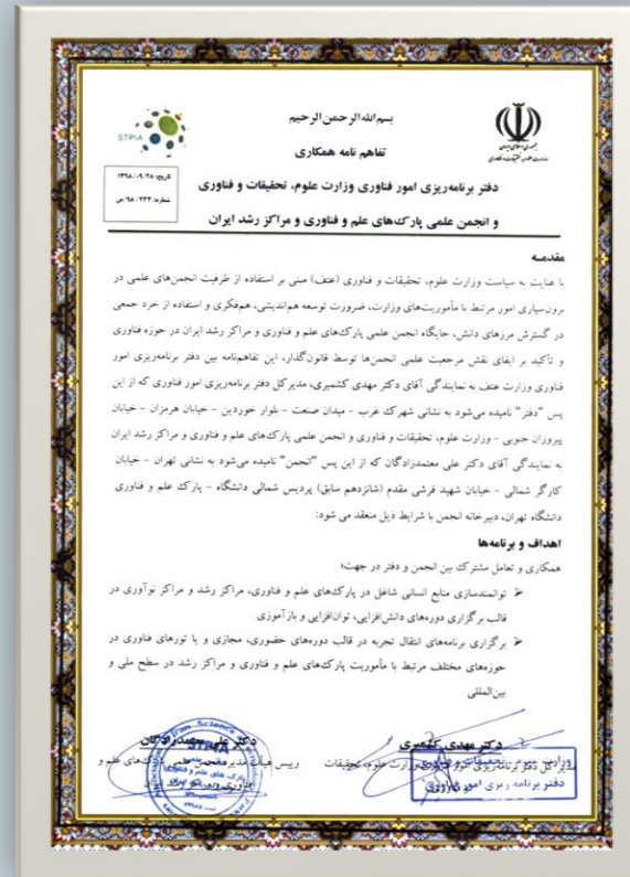
وزارت علوم، تحقیقات و فناوری