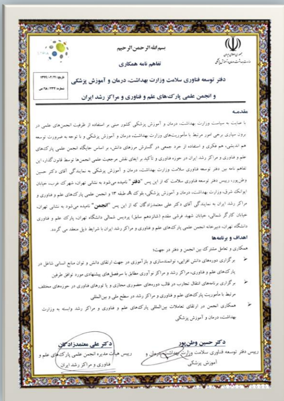
وزارت بهداشت، درمان و آموزش پزشکی